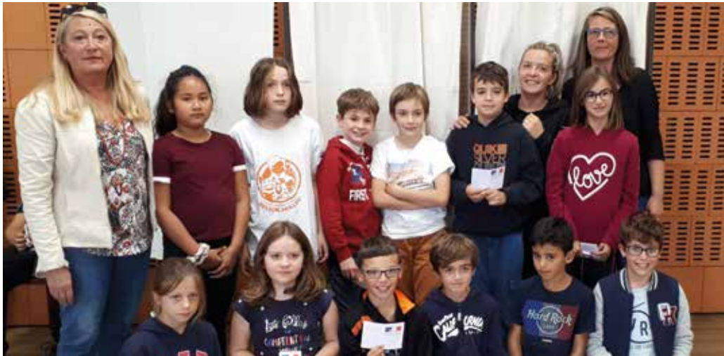
Le Conseil Municipal d'Enfants vient d'être renouvelé.