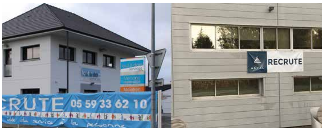
Plusieurs entreprises de la zone d'activité recrutent.