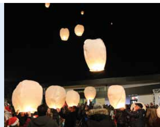
Le lâcher de lanternes, depuis la place des Pyrénées, sera l'un des moments forts de cette fin de journée.

Les petits pourront voir le père Noël et même faire un tour de calèche avec lui! Vers 18h30, les plus grands pourront participer à un lâcher de lanternes depuis la place des Pyrénées. Cette soirée sera aussi l'occasion de faire un geste de solidarité au profit du secours populaire en déposant vos « vieux » jouets sous le grand sapin installé pour l'occasion. Le centre de loisirs fera un flash mob et compte sur vous pour danser avec eux. Les élèves du lycée agricole apporteront avec eux des animaux de la ferme et proposeront plusieurs animations pour les enfants (maquillage, chamboule tout,