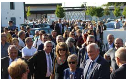
La foule a déambulé entre les différents sites.