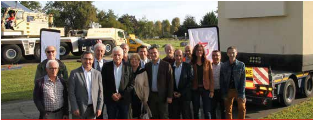
Les élus du territoire se réjouissent de la pose des NRO sur le territoire.

C'est dans la rue de Laruns à Serres-Castet que le premier Nœud de Raccordement Optique (NRO) de la Communauté de Communes des Luys en Béarn a été posé jeudi 3 octobre. Ce NRO est l'un des 68 que comptera le réseau départemental une fois achevé.