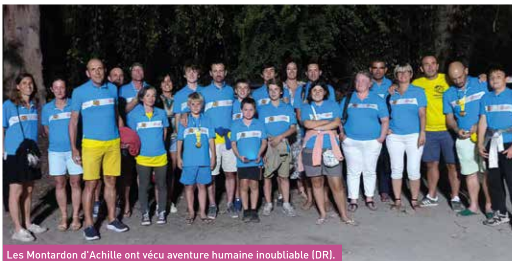
Les Montardon d'Achille ont vécu aventure humaine inoubliable (DR).

Neuf coureurs des « Montardon d'Achille » participaient au grand raid sur l'île de la Réunion du 17 au 20 octobre.