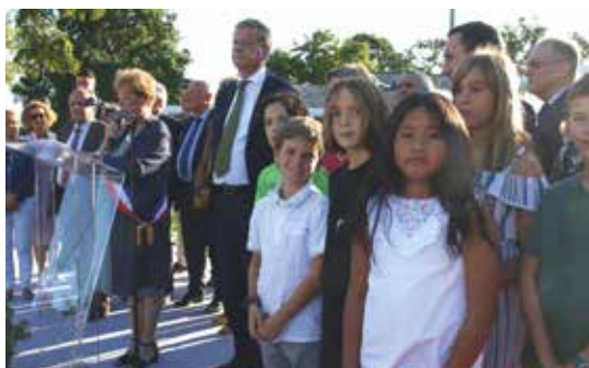
Le Conseil Municipal des Enfants a été mis à l'honneur par les élus.

L'inauguration du bas du village s'est faite le vendredi 6 septembre en présence d'Eric Spitz, préfet des Pyrénées-Atlantiques.