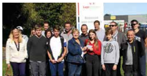
Le chantier « jeunes » s'est terminé avec un repas pris au Restaurant Inter-Entreprises Sodexo de Serres Castet.

La municipalité de Montardon accueillait quatre jeunes du village, du 21 au 25 octobre, dans le cadre des ateliers jeunes. Un projet émanant de la Communauté de Communes des Luys en Béarn.