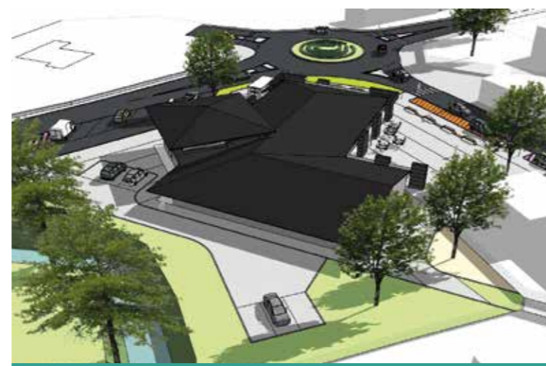
Les esquisses du projet.