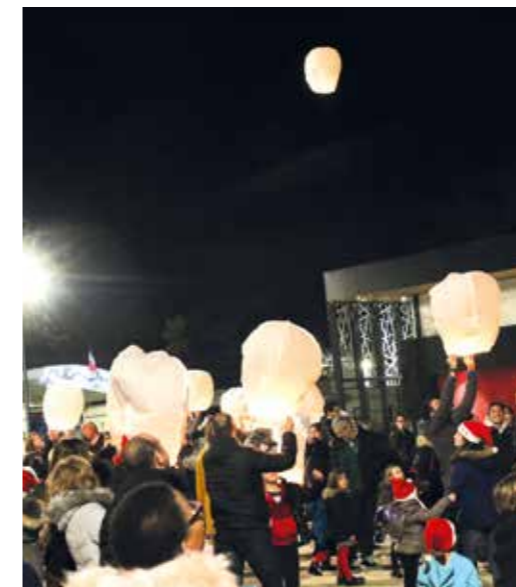
Le lâcher de lanternes pour les animations de Noël, était une idée du conseil municipal d'enfants.

Un point sur les projets proposés par les commissions CME 2017/18. Quelles sont les idées retenues et exploitées par la mairie? Réponses.