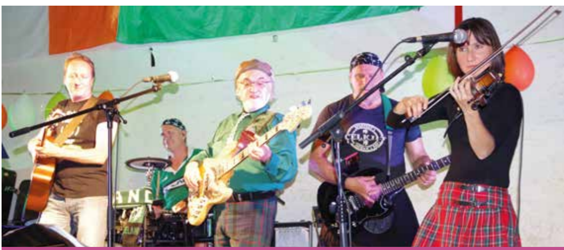
L'an passé, le groupe the Fo's Celtic était déjà de la fête.

Le comité des fêtes organise la quatrième édition des fêtes celtiques ce samedi 13 avril à partir de 18h30 dans la salle polyvalente de Montardon. En première partie, les cornemuses "Piperade" ouvriront les festivités. À noter