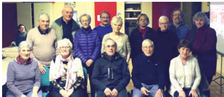
Los Esvagats maintiennent le cap.