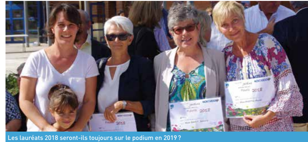
Les lauréats 2018 seront-ils toujours sur le podium en 2019 ?

Pour la 3 e année consécutive, la commune de Montardon organise un concours "Jardins, Terrasse et balcon fleuris".