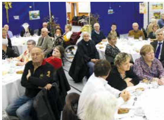
Les aînés apprécient toujours ce traditionnel repas.

La commune de Montardon vend du bois sur pied ou déjà coupé. Les prix de vente sont déterminés suivant l'importance des lots. Une inscription est obligatoire auprès des services de la mairie. Pour tout renseignement : 05 59 33 22 63