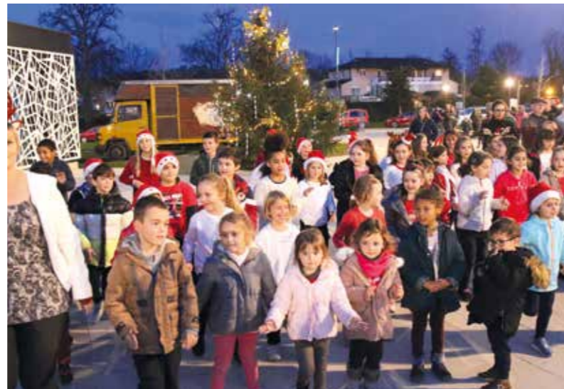
Le Flashmob, très rock and roll, proposé par les enfants du centre de loisirs a beaucoup plu.

Tout a débuté par un Flashmob, très rock and roll, proposé par les enfants du centre de loisirs. À la tombée de la nuit, le lâcher de lanternes depuis la place du village, n'a fait que des heureux. Les élèves du lycée agricole avaient eu l'excellente idée de mettre en place une mini-ferme pour le plus grand plaisir des enfants et des parents. Les différents concerts donnés par les élèves de l'école de musique sur la place du village et dans l'auditorium ont bercé une foule plongée dans la douceur de Noël, autour d'un vin et chocolat chauds offert par la municipalité.