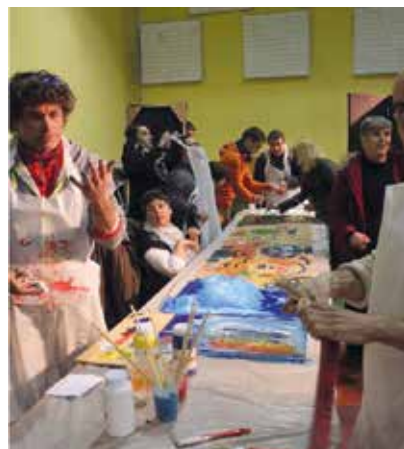
L'an passé, les ateliers d'initiations à diverses techniques artistiques avaient connu un gros succès.

L'association « Arts Muse et Vous » organise la 3 e édition du festival « Rencontre Art Culture pour Tous » les 17, 18 et 19 mars dans la salle polyvalente et dans l'école de Musique Intercommunale à Montardon.