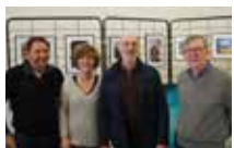
Quelques membres du club.

Le club photo « Mise au point » regroupe des amateurs de photographie débutants ou confirmés. Des réunions sont organisées les mercredis de 18h à 20h à la Maison