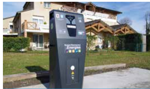
Montardon est désormais équipé d'une borne pour recharger les véhicules électriques et hybrides.

➤ Pour tout renseignement : www.mobive.fr