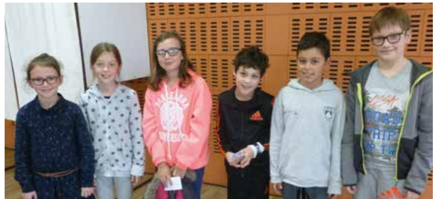
Les six nouveaux élus au Conseil Municipal des Enfants

F in novembre, 6 élèves de CM1, (3 filles et 3 garçons) ont été élus au Conseil Municipal des Enfants (CME). Ces élections avaient pour but de renouveler les conseillers des classes de CM2, partis en septembre en 6e au collège de Serres Castet. Le CME est composé de 12 enfants : 6 CM2 et 6 CM1 élus pour une durée de 2 ans. De ce fait, chaque année, les enfants de CM1 et CM2 élisent 6 nouveaux conseillers, 3 filles et 3 garçons, parité oblige, issus des classes de CM1. Ces dernières élections se sont déroulées dans les règles, avec des cartes d'électeurs factices, mais des isolements et une urne bien réels.