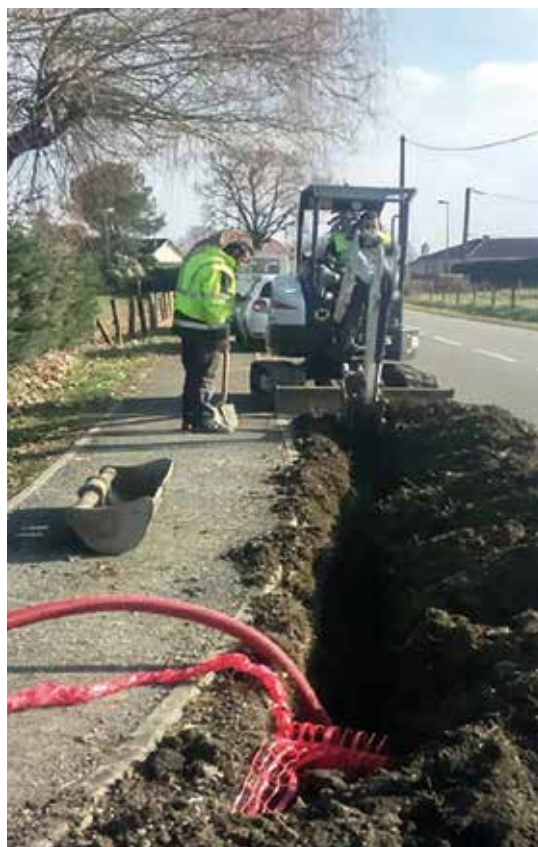
Les employés communaux participent activement à ces travaux.

de serre induits, de l'éco-conception et du recyclage des matériels utilisés, ainsi que de la capacité d'observation du ciel nocturne pour les générations actuelles et à venir. Il valorise nationalement les communes qui agissent dans une démarche de progrès.