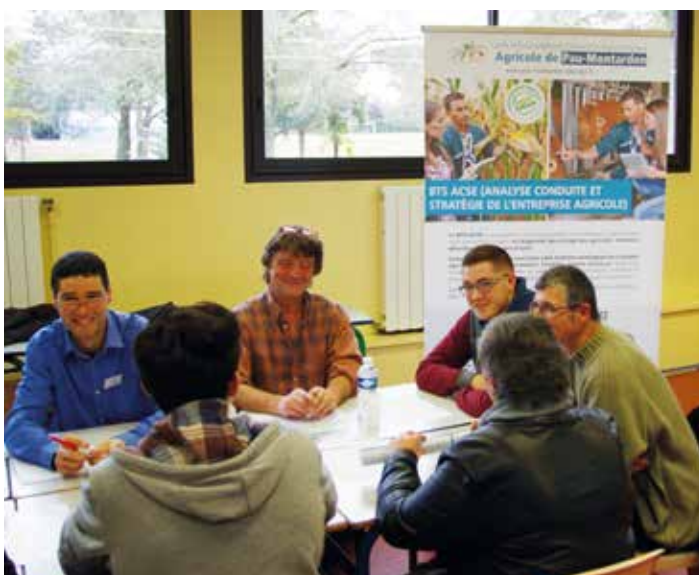
Les élèves de terminale des lycées de l'agglomération paloise, s'intéressent de près aux BTS proposés par les lycées agricoles du département (Montardon, Hasparren et Oloron).

• Par apprentissage : BTS Développement Animations des Territoires Ruraux et BTS Technico Commercial Vente de Végétaux d'Ornement.